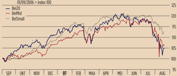
Bel20 versus BelMid versus BelSmall