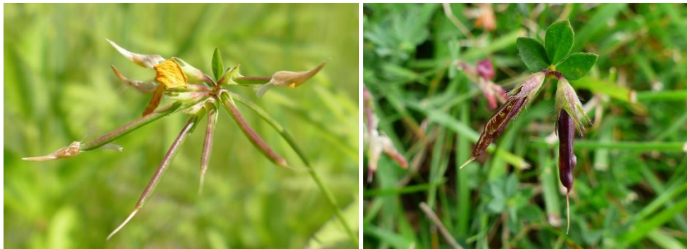
Foto links: nieuw ontwikkelde rolklaverpeulen. Foto rechts: meer rijpe rolklaverpeulen, één is nog gesloten en de andere is al geopend.

Ook voor de rolklaverplant willen we naast het aantal bloemen ook het aantal vruchten weten op twee tijdstippen tijdens het project (eind mei en eind juni). De vruchten van rolklaver zijn peulen, deze lijken op kleine boontjes (zie foto's hieronder). We willen dat je de peulen telt aan het einde van mei en aan het einde van juni . Zowel open als gesloten peulen moeten geteld worden. Je kan de resultaten van deze telling onmiddellijk ingeven via de projectwebsite (hiervoor heb je je persoonlijke code nodig die vermeld staat in de begeleidende brief).