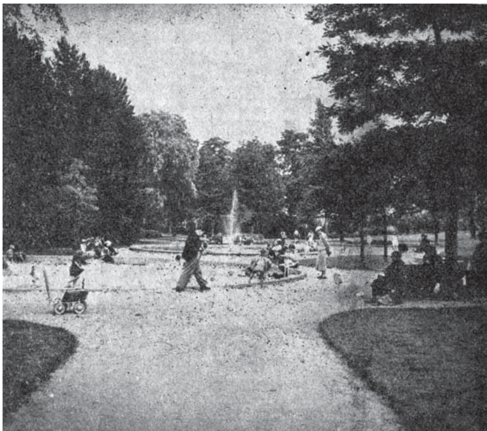
Afbeelding 4: Nieuw parkje en speelplein nabij de stadsbegraafplaats.

schilderen een ander mentaliteit als de onze, deden ons begrijpen dat die vrouw een ander begrip had in zake eerbiediging der openbare beplantingen.