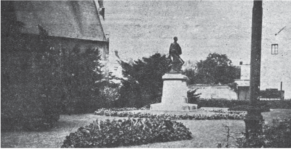
Afbeelding 5: Heraangelegd plantsoen naast de Sint-Jacobskerk. Onderschrift: 'Bij aanstelling van het nieuw bestuur beweerden de katholieken dat de socialisten den godsdienst zouden aanvallen en schaden. Loutere verdachtmaking! [...] De socialisten, in akkoord met de geestelijkheid, schepten [sic] rond vele kerken prachtige tuinen.'

leverd, maar volgens de krant was het stedelijk tewerkstellingsbeleid doordrongen van 'vriendjespolitiek'. 63 Bovendien werd het stadsnatuurbeleid sarcastisch afgeschilderd als een antiklerikaal prestigeproject: 'Ge zult [in het nieuwe Albertlaan-parkje] de liberalen en socialisten [...] zien huppelen, dartelen als snullen, tuimelinkskes maken gelijk jonge snaken, schreeuwen en tieren dat het stof in de lucht zal vliegen'. 64 De Volkswil reageerde door te suggereren dat de kinderen van de 'klerikale' politici geen speelpleinen nodig hadden: zij konden hun vakantie immers wél 'aan zee' doorbrengen. Daarnaast stelde de socialistische krant dat de nieuwe parkjes gedeeltelijk werden gesubsidieerd door het provinciebestuur, en dat deze subsidies reeds werden aangeboden ten tijde van het katholiek-liberale schepencollege, maar toen ongebruikt waren gebleven. 65