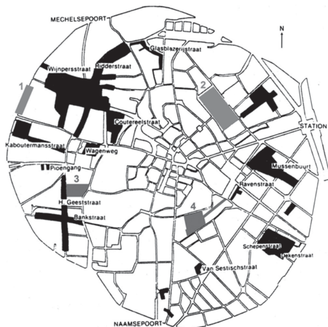
Afbeelding 1: Locaties van door Lens geplande groen-zones: (1) Park ter vervanging van de schietbaan; (2) Park ter vervanging van de Sint-Maartenskazerne. Bestaande openbare groenzones in 1918: (3) Kruidtuin; (4) Stadspark; (Ringtraject) Stadsvesten. De zwarte vlakken duiden op wijken met een grote concentratie van arbeiderswoningen. (Op basis van kaart uit: J. Brepoels e.a. [red.], Stadsboek Leuven [Leuven 1985] 106.)

(afgekort NMGW). 25 Het Leuvense rapport bevatte immers geen spoor van de initiële naoorlogse doelstelling van de NMGW om via tuinwijken een nieuwe sociale cohesie te creëren, en ook de intentie om lagere en middenklassen in eenvormige woonwijken samen te brengen, was helemaal afwezig. De tuinwijk verscheen bij Lens niet als de ruimte waar een nieuw gemeenschapsleven tot stand moest (of kon) komen, maar veeleer als een plaats waar de arbeider zich na de werkuren uit de publieke sfeer moest terugtrekken, in het besloten kader van de individuele woning en tuin.