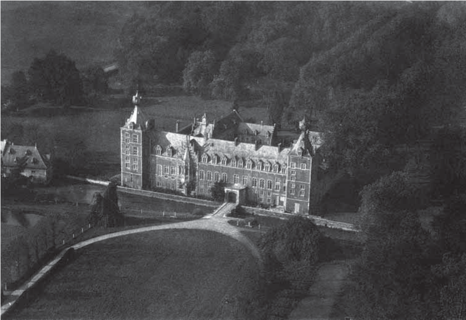
Afbeelding 3: Ongedateerde luchtfoto (vermoedelijk uit de jaren 1920) van het Arenbergkasteel en een deel van het omliggende park.

kon hebben op het stedelijk leefmilieu, was dus ook aan het begin van de jaren 1920 nog niet algemeen aanvaard. Rooien zonder te herbepanten werd door Le Libéral echter afgewezen als een 'extreme' suggestie. 41