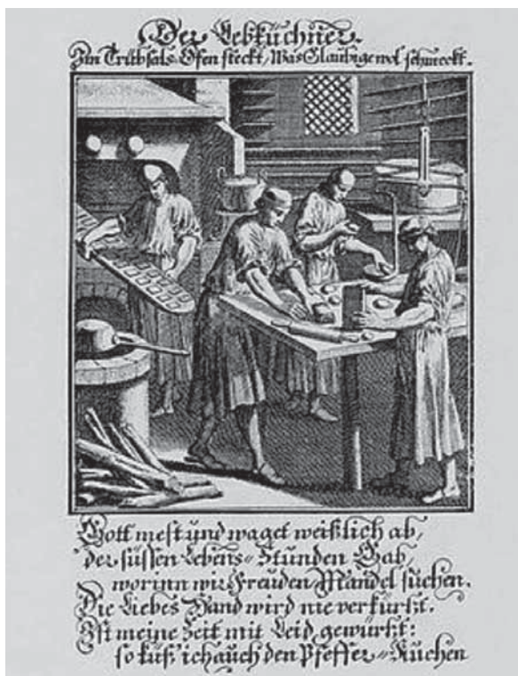
Afbeelding 2: 'Koekebakker', Prent van Jan Luyken, 1698; Christoph Weigel, Abbildung der Gemein-Nützlichen Haupt- Stände, Ständebuch .