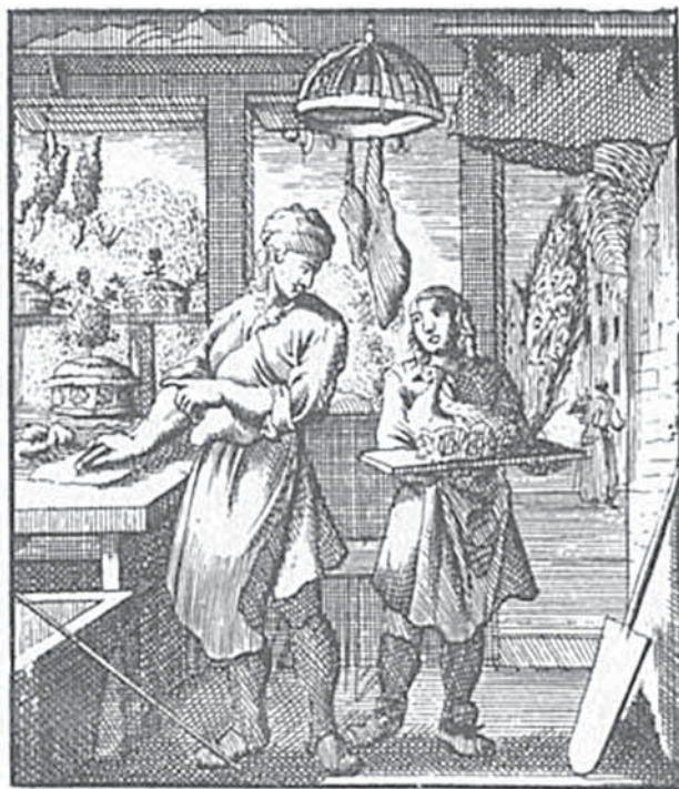
Afbeelding 4: 'Pasteibakker', Prent van Jan Luyken, 1694, Jan Luyken, Afbeelding der Menschelyke Bezigheden, Spiegel van het Menslyk Bedryf (Amsterdam 1753).

één of meerdere kinderen huwden en de ouderlijke bakkerij verlieten. Niettemin kon voor elk van de zeventien casussen vastgesteld worden dat minstens één bakkerszoon werkzaam bleef in de bakkerij, huwde en er samen met zijn echtgenote werkzaam bleef, al dan niet in samenwerking met ongehuwde broers en zussen onder de hoede van de 'weduwe-boulangère' die in elk van de gevallen eigenares van het pand bleef tot aan haar overlijden.