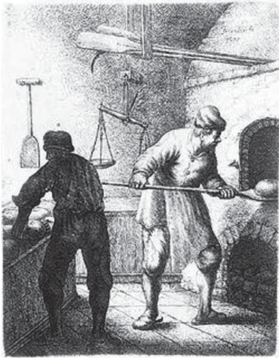
Afbeelding 1: 'Bakker', Ets van J.G. Van Vliet, 1635, Rotterdam, Atlas van Stolk, Tekeningen Van Vliet .

monium of beroep? Voor het beantwoorden van deze vraag zal in dit artikel worden ingezoomd op de Brusselse bakkers, een typische en relatief stabiele stedelijke midden-groep. Ook de keuze voor de hoofdstad van de Oostenrijkse Nederlanden biedt interessante perspectieven. Vanaf de tweede helft van de achttiende eeuw tekende zich in Brussel, meer dan elders, een spanningsveld af tussen een behoudsgezinde corporatieve wereld enerzijds en de 'moderne wereld' beheerst door het grootkapitaal en groepen uit de financiële wereld en de vrije beroepen, anderzijds. Brussel transformeerde op enkele generaties tijd van een 'corporatistisch bolwerk' naar de eerste moderne (liberale) natiestaat op het continent. De bakkers, die enerzijds stevig geworteld waren in de corporatieve wereld en zich anderzijds dienden aan te passen aan de vereisten van een moderne kleinhandelssector, moeten deze spanning ongetwijfeld hebben gevoeld.