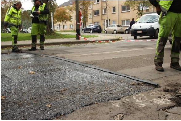
Figuur 4: sectie 4: Edelsteenstraat