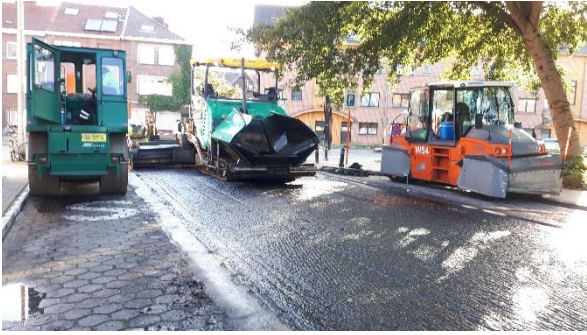
Figuur 2: begin proefzone : kruispunt Zwijnaardsesteenweg