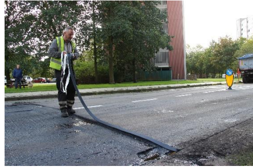
Figuur 3: einde sectie 3