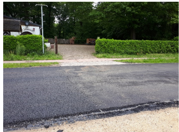
Figuur 2: einde sectie 3