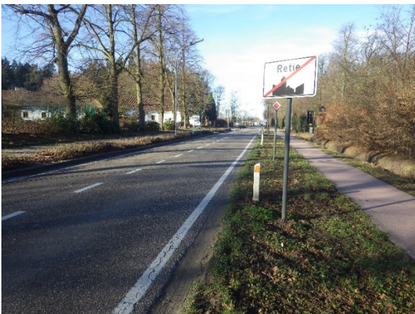
Figuur 1: start sectie 1