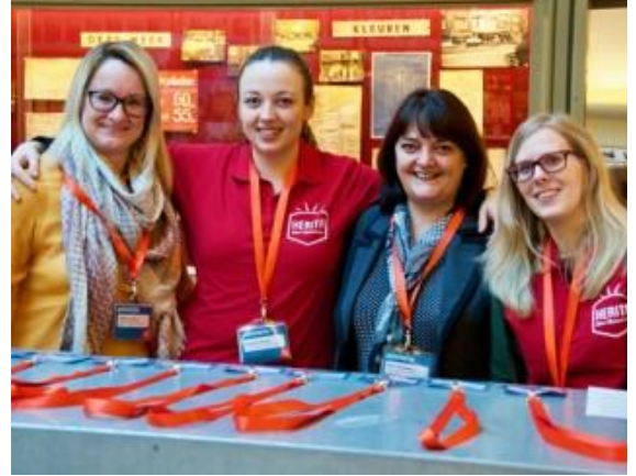
Herita ( www.herita.be )