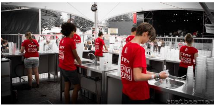
Boomtown Festival ( www.boomtownfestival.tumblr.com )