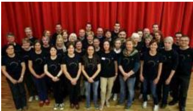
De Warande ( www.dewarande.be )