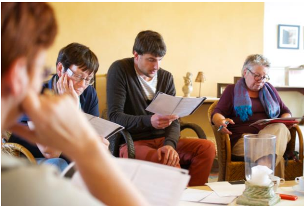
Het Lezerscollectief ( www.lezerscollectief.be )