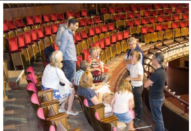
De Roma ( www.deroma.be )