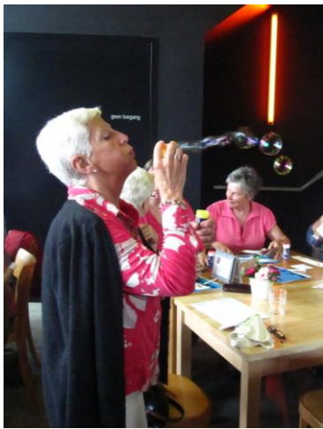
Dinamo ( www.dinamo.warande.be )