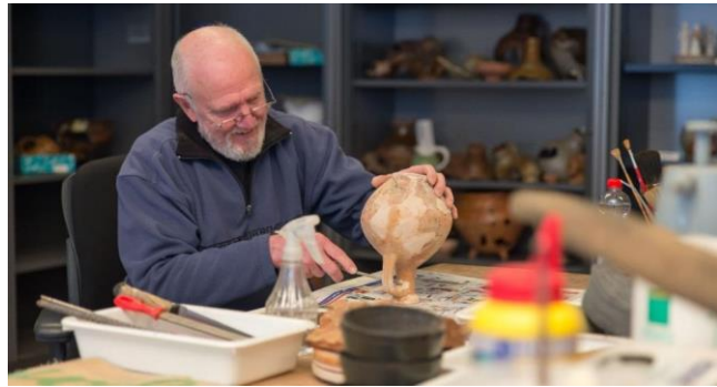
AWN Vereniging van Vrijwilligers in de Archeologie ( www.awn-archeologie.nl )