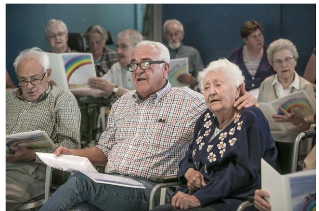
Koor & Stem ( www.koorenstem.be )