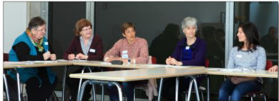
10 maart 2017 - Workshops @ VITAMINEBOOST