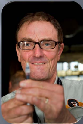
Vaccinatie bij de huisarts