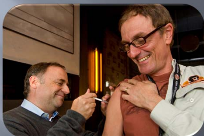
Vaccinatie bij de huisarts