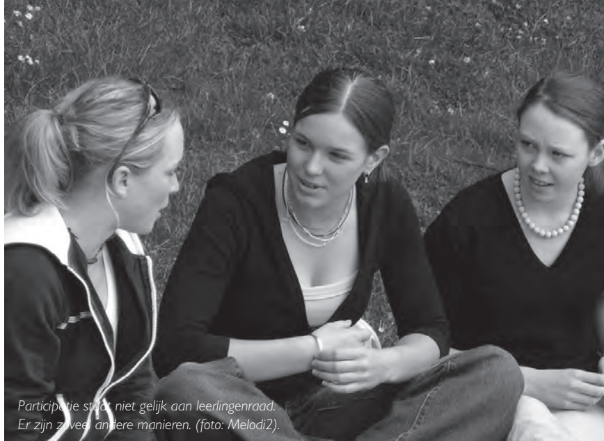
Participatie staat niet gelijk aan leerlingenraad. Er zijn zoveel andere manieren..

Leerlingenparticipatie verloopt op de ene school al wat vlotter dan de andere. Voor je begint te wanhopen ('dat zou bij ons nooit lukken!'), weet dat je er niet alleen voor staat. Al je collega's hebben de taak om te werken aan leerlingenparticipatie. Je kan trouwens voor verdere ondersteuning en vorming (voor leerkrachten én leerlingen) altijd terecht bij de Vlaamse Scholierenkoepel, gaande van een telefoongesprek vol tips tot een intensieve trajectbegeleiding.