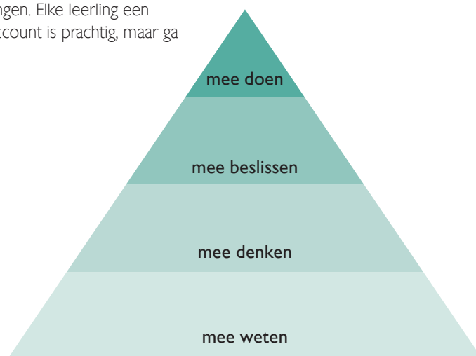
Figuur 1. De participatiepiramide

Vaak zijn leerlingen al 'participatievervaardigd' nadat ze hun ei hebben kunnen leggen, maar een groep wil graag nog een stapje verder. Zij willen deel uitmaken van het beslissingsproces. Voor veel leerlingen