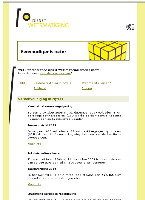
Figuur 2: Voorbeeld van Nieuwsbrief wetsmatiging