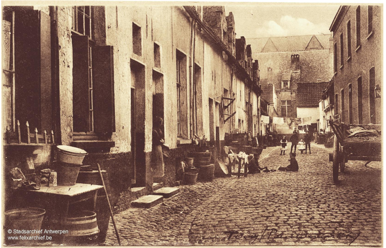
Foto: Toog, inblik in de straat, Antwerpen, 1900

Laat Toog rechts liggen en vervolg je weg langs de Paardenmarkt in de richting van de kerktoren.