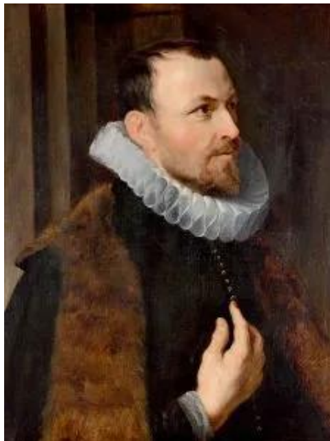
Afbeelding: Nicolaas Rockox

In de aristocratische Keizerstraat staan prachtige huizen van 16 de - en 17 de -eeuwse handelaren, bankieren en politici. Ook Nicolaas Rockox – burgemeester, mecenas, vriend en belangrijkste opdrachtgever van de schilder Rubens – woonde hier met zijn gezin in nummer 10. Van twee huizen maakte hij een prachtige patriciërswooning. Een bank herstelde deze in al haar glorie. In de salons kan je kennis maken met kunstwerken uit de barok. Er ligt ook een 16 de -eeuwse tuin.