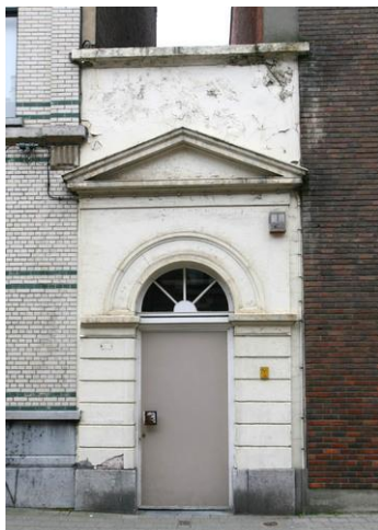
Foto: Antwerpen Rodestraat 16 (auteur: Kris Vandevorst), Bron: Beeldbank Onroerend Erfgoed, https://id.erfgoed.net/afbeeldingen/35571

Op nummer 16 zie je een overblijfsel van het verdwenen Godshuis der Zeven Bloedstortingen , in 1843 gebouwd in opdracht van het Bestuur der Burgerlijke Godshuizen. Ook op nummer 26 lag er overigens een godshuis dat inmiddels is verdwenen: Sint-Blasius.