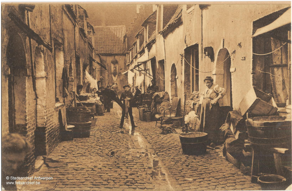
Foto: Bredestraat (nr 36/1-16): de "Bijlengang" Antwerpen ca. 1900

Het gevolg was een overbevolking en een schrijnende woontoestand. Grote delen van de stad evolueerden tot armengetto's waar krottenrijen in de bekende gangen massa's mensen in beestachtige omstandigheden moesten huisvesten. Deze getto's waren grotendeels gesitueerd in de vroegere armenbuurten. Dit was zo in Sint Andries maar ook in de zone Kleine Kauwenberg – Lange Winkelstraat. Het Zwanenganggetto omvatte alle verbindingstraten tussen Ossenmarkt en Kipdorp (inclusief de vele gangen).