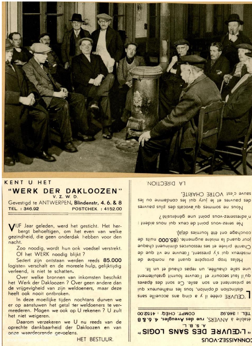
Afbeelding: het werk der daklozen, Antwerpen, 1930