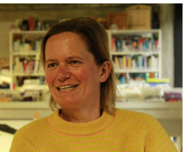
S Hertsens Consulent Taal