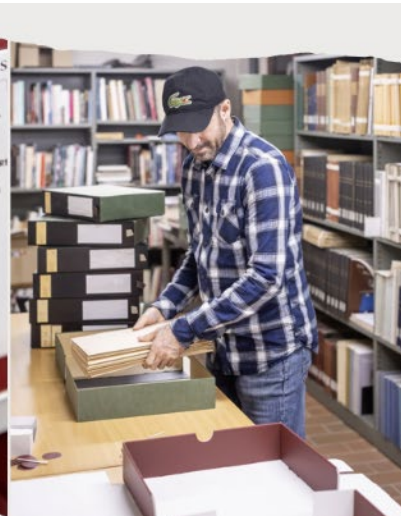
HERPAKKEN & HERLABELLEN