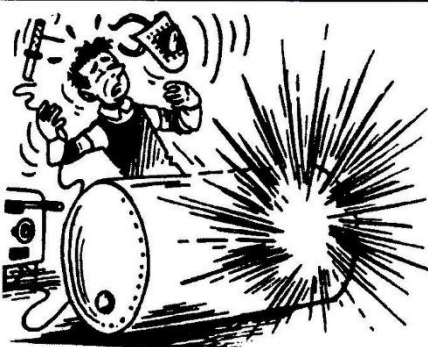
Fig. 1. Ontploffing als gevolg van een onvolledige «ontgassing».