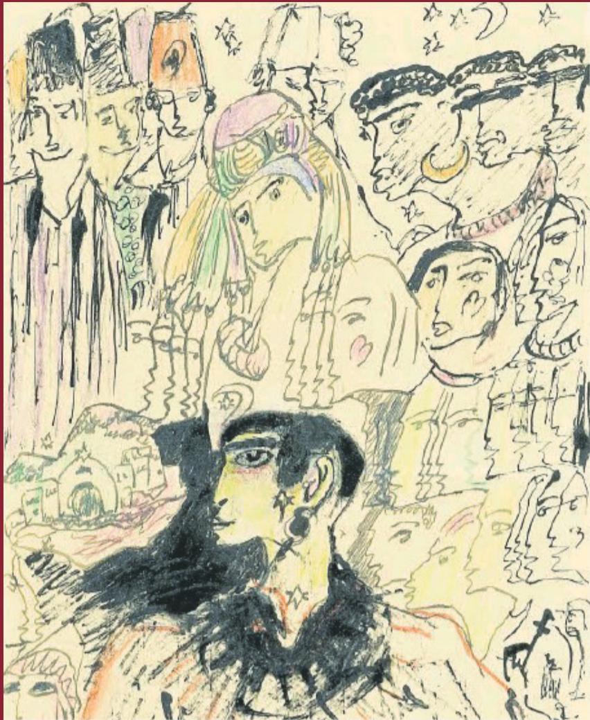
Else Lasker-Schüler, Nicodemus (1923).