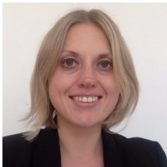
KIM WATTS Compensation funds in a comparative perspective