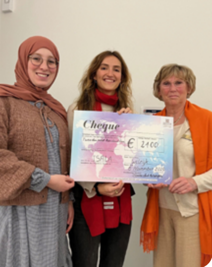
↑ Zonta Antwerpen schenkt € 2.100 aan Luna