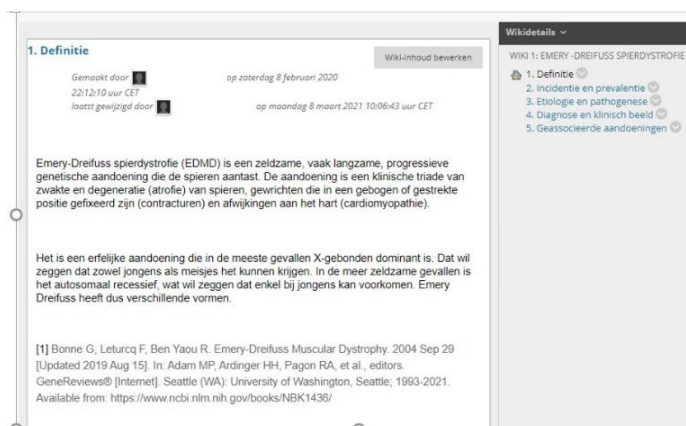
Figuur 1: Voorbeeld van een wiki gemaakt door studenten 3 de Bachelor Kinesithérapie bij kinderen

onderwijsteam gestructureerde wiki werken de studenten in groep een aantal aspecten van een bepaald syndroom uit op basis van recente wetenschappelijke literatuur. Op dat moment hebben de studenten enkel toegang tot hun eigen wiki. Eens het onderwijsteam de inhoud gecontroleerd heeft, worden de wiki's van de verschillende syndromen voor de andere groepen opengesteld. Vervolgens dienen de wiki's als cursusmateriaal en vergelijken de groepen in een tweede deel van de groepsopdracht verschillende aspecten op basis van de wiki's van de andere groepen, zoals bijv. de incidentie en prevalentie van het syndroom dat zij uitwerkten. De wiki wordt hier met andere woorden gebruikt als tool om studenten in groep wetenschappelijke informatie te leren verzamelen, deze te filteren op bruikbaarheid in een specifieke context (een patiënt met een zeldzaam syndroom die zich in de praktijk aanbiedt) en te leren om deze te rapporteren naar collega's.