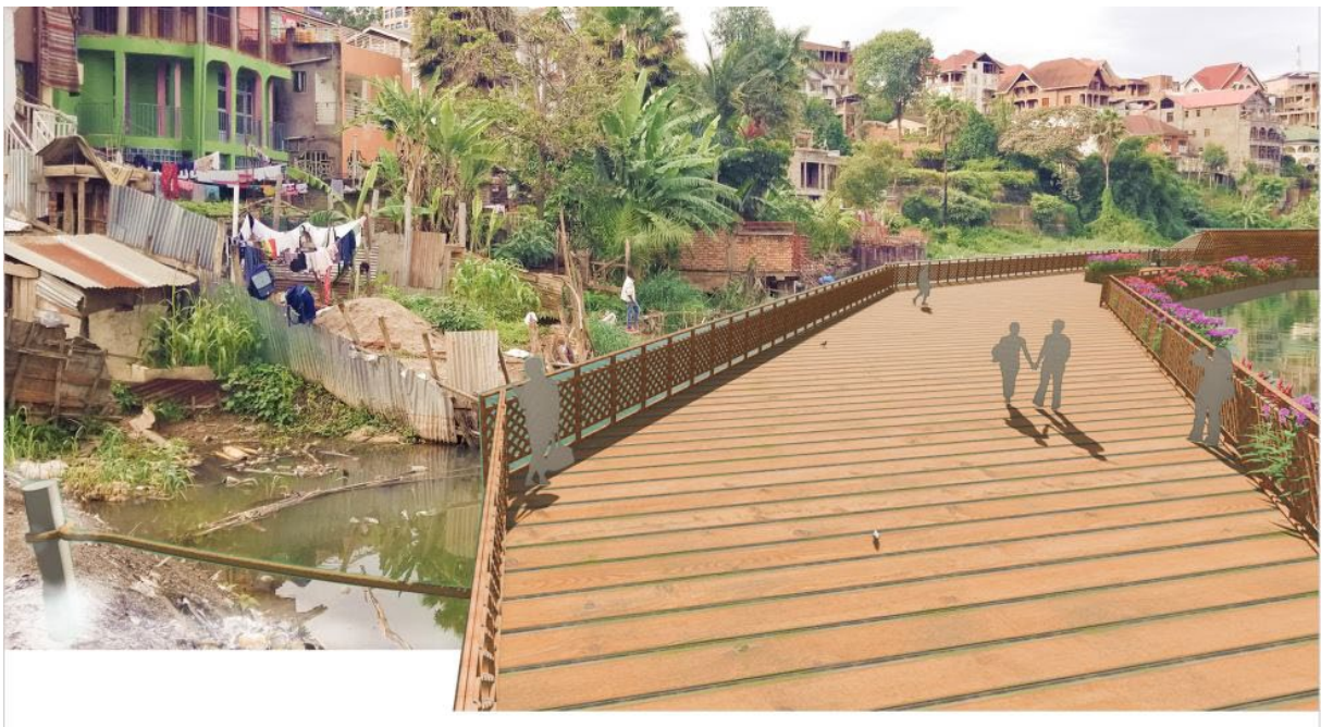
Figure 3 : Vue de la rive flottante

Pour EA-10122023-OI-72, en futur architecte écologiste, il propose une rive flottante le long des rives du lac Kivu pour résoudre les problèmes d'embouteillages et de constructions non conformes aux normes congolaises. Sa conception, réalisée avec des gabions composés de bouteilles plastiques recyclées, offre également un espace de divertissement pour les riverains. Par son projet, Armand propose de ne pas démolir les maisons qui dépassent les rives mais plutôt de créer une ceinture le long de cette rive avec un espace de détente pour les populations riveraines. Cette rive flottante part de la rivière Ruzizi (à Nguba) à La Botte, la figure 3 illustre mieux ce projet et la figure 4 présente l'image de l'espace récréatif à construire sur la rive flottante.