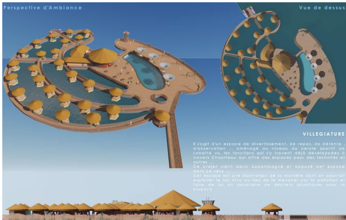
Figure 4 : Espace récréatif de la rive flottante