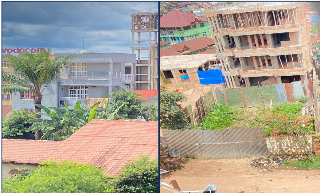
Figure 2 : Illustration de la dimension des parcelles et maisons dans le centre ville