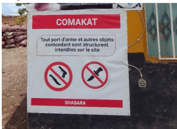
Images 1-7. Les interdits dans les sites