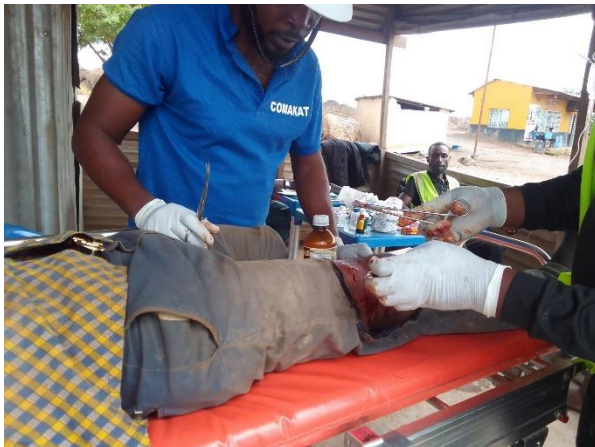
Images 10-12. L'intervention d'un secouriste

Mais quand quelqu'un meurt par accident, là maintenant la coopérative assiste pour l'enterrement en achetant le cercueil, c'est la seule assistance de la coopérative que je connais (entretien, Kolwezi, le 13 février 2023).