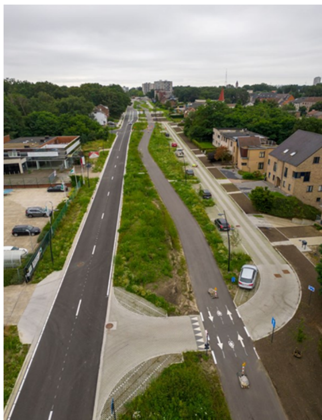
Figuur 3. Heraanleg van E. Coppeelaan, Genk, met vervanging van de riolering, waarbij groene infrastructuur wordt ingezet om het hemelwater te bufferen en laten infiltreren. Bij deze volledige heraanleg geldt ook een afkoppelingsplicht voor aangrenzende gebouwen. 20

Scenario 2: 270 miljoen euro , wanneer er gewerkt wordt met een combinatie van retrofits, ontharding (met herinrichting bovenbouw) en het volledig vervangen van gemengde oude rioleringsstrengen (daterende van 1950 – 1970). Er wordt met dit scenario verder gewerkt als totale kost voor het realiseren spoor 2, de sponsmaatregelen.