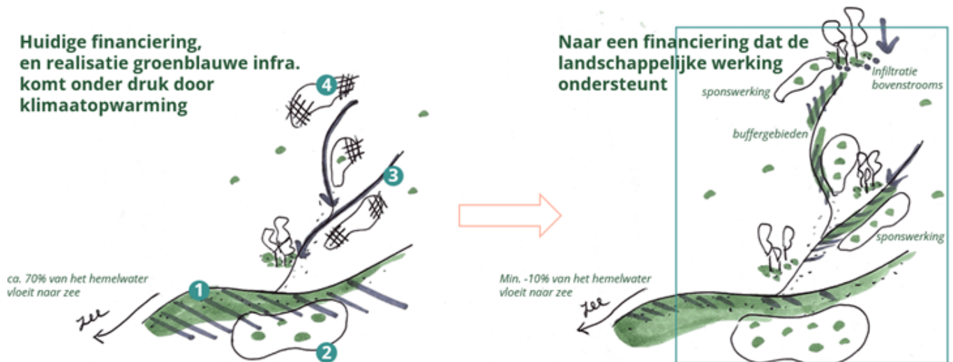
Figuur 5. Verschuiving van de huidige financiering naar een socio-ecologische financiering op bekkenniveau.

Om deze verschuiving te realiseren, wordt de financiering van waterbeheer omgedraaid, met volledige focus op hemelwaterbeheer. De middelen uit de drie waterdeeltaken – drinkwatervoorziening, afvalwaterinzameling en -zuivering, en watersysteembeheer – worden gedeeltelijk geheroriënteerd naar groenblauwe bronmaatregelen. Daarnaast worden budgetten voor landschapontwikkeling en natuurbeheer (bv. vanuit ANB en VLM) in dit model geïntegreerd.