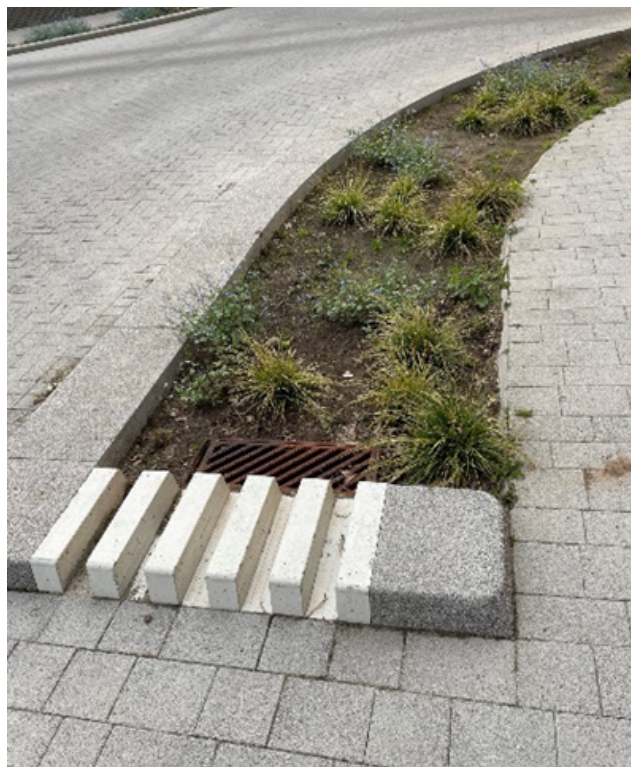
Figuur 2. Retrofit in de Mezenstraat, Genk. De bestaande gemengde riolering wordt niet vervangen, het regenwater wordt gebufferd in de groene berm vooraleer het richting slokker vloeit. Het wegdek werd minimaal heraangelegd, er wordt vooral onthard. 19

Scenario 1: 50 miljoen euro , indien er enkel gewerkt wordt met retrofits in bestaande groenbermen. Er wordt echter gevreesd dat dit niet voldoende zal zijn om de doelstellingen wat betreft het reduceren van de overstortwerking, het realiseren van klimaatrobuuste wijken en de vallei voldoende te vernatten.