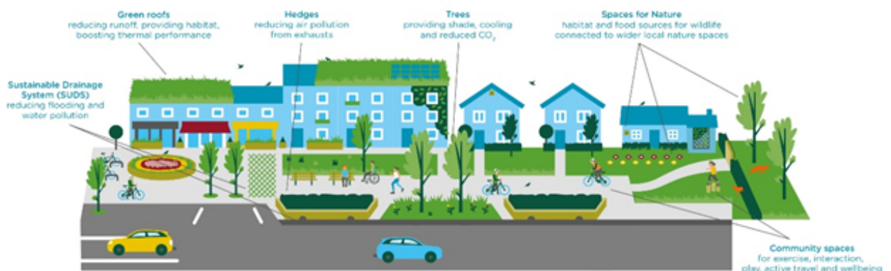
Figuur 1. Infografiek over de baten van sponsmaatregelen (of groene infrastructuur). Beeld ontwikkeld door Natural Resources Wales (juli 2023) 9 Tabel 1. Maatregelen spoor 2 om hemelwater aan de bron op te vangen, infiltreren en bufferen