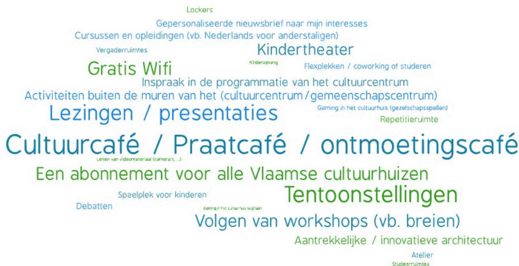
Figuur 3: Wordcloud cultuurhuis van de toekomst

We zien een duidelijke uitschieter: cultuurcafé, ontmoetingscafé, praatcafé werd door bijna de helft van de respondenten aangeduid. De sociale functie van het cultuurhuis wordt daarmee in de verf gezet. Ook tentoonstellingen (36%) en lezingen (31%) scoren hoger, gevolgd door (gratis) Wifi (23%), een abonnement voor alle Vlaamse cultuurhuizen (22%) en workshops (21%).